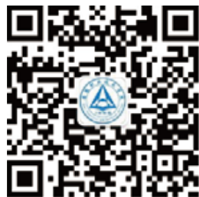
安徽职业技术学院官微