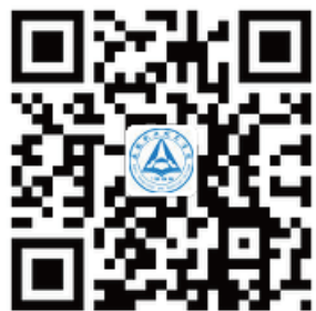
安徽职业技术学院官方微博