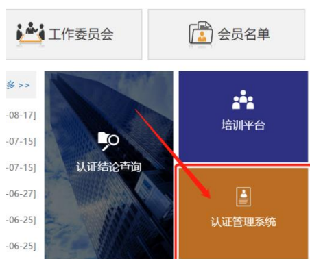
图 1 系统入口

在中国工程教育专业认证协会网站 ( https://www.cceaa.org.cn/ ) 中，点击“认证管理系统”模块，进入“中国工程教育专业认证管理信息系统”。