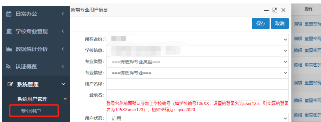
图 4 学校账户可新增、管理专业账户

学校账号注册申请审核通过后, 登录院校账户进入系统, 点击【系统管理】-【系统用户管理】-【专业用户】, 可新增、管理该校的专业账户(图 4)。