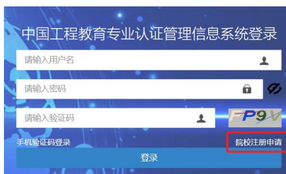
图 2 系统登录界面