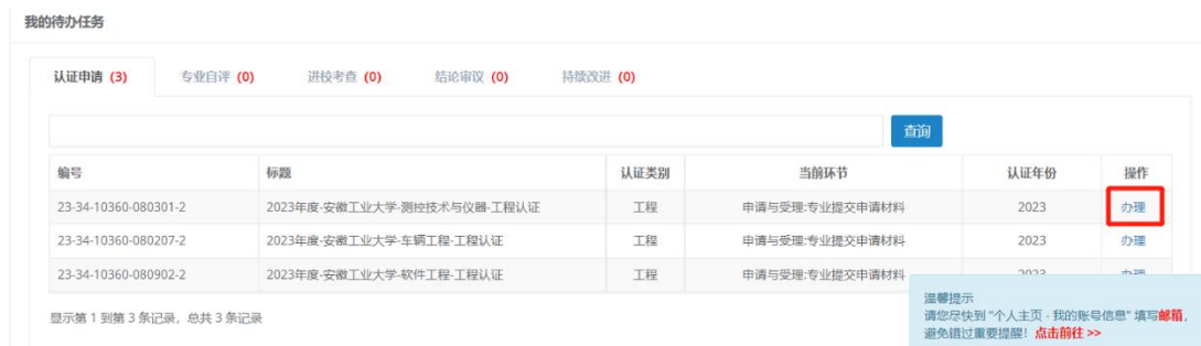
图10 学校确认申请材料

学校账户在首页【待办任务】中，点击【办理】，检查专业提交材料、补充上传盖章、签字的申请书首页。