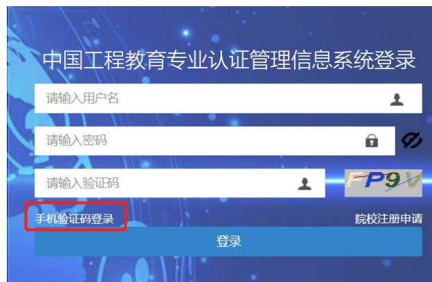
图5 点击手机验证码登录，切换登录界面

可通过学校（专业）联系人手机验证码登录（见图5）。如专业忘记用户名或密码，可请学校管理账户查询、重置。