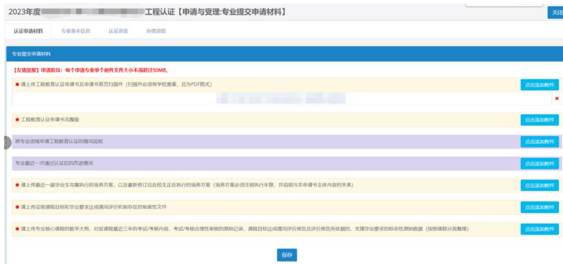
图 8 材料上传页面

除申请书盖章首页学校和专业都可上传外，其他所有材料需专业上传。点击【保存】，完成申请资料上传。