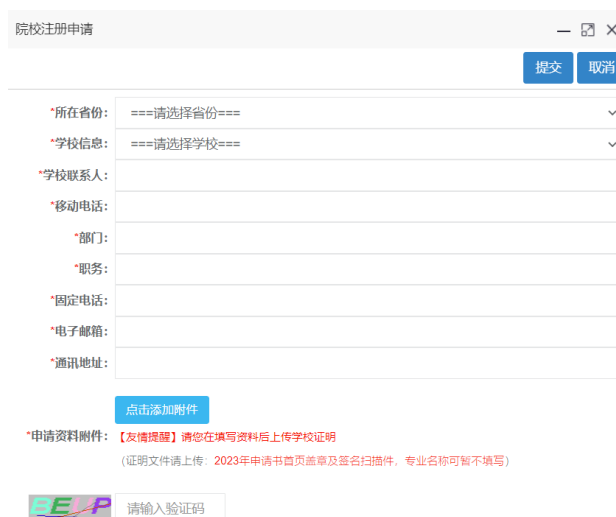
图 3 学校注册页面