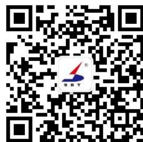
苏博特招聘公众号