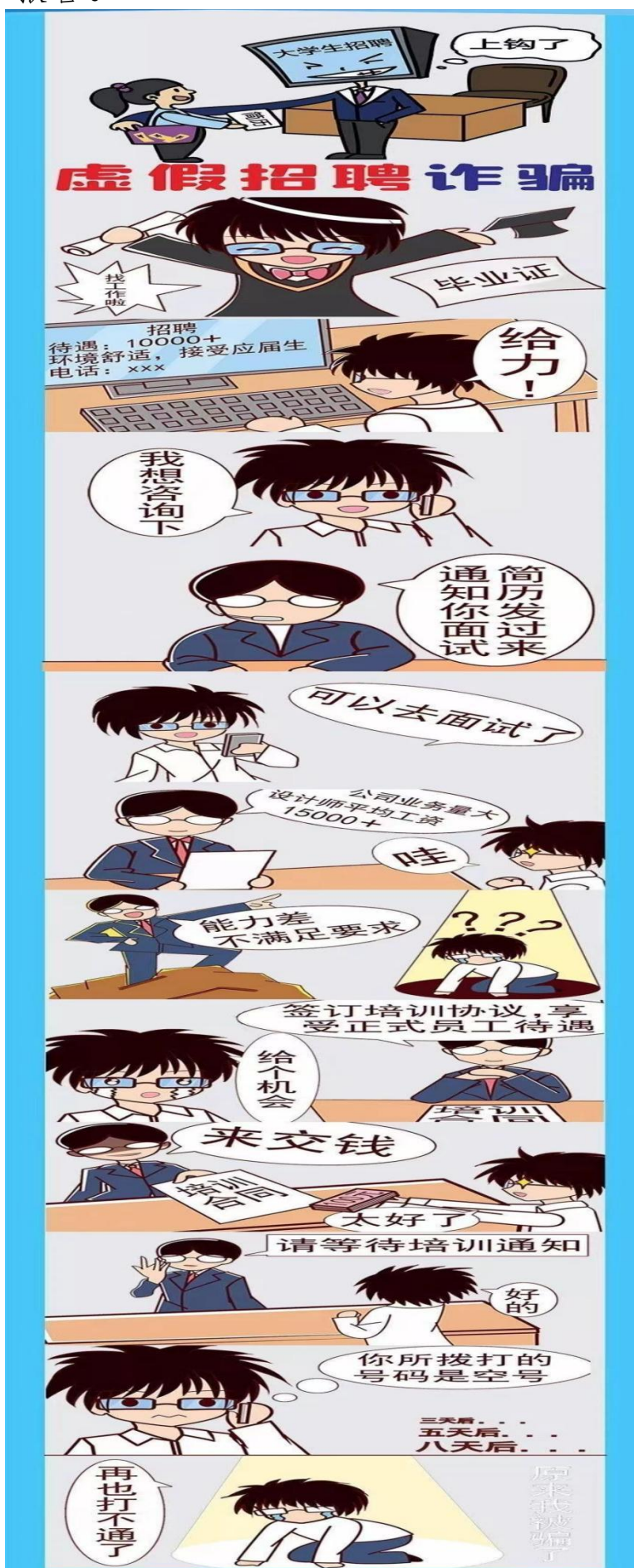
(艺术学院学生创作)