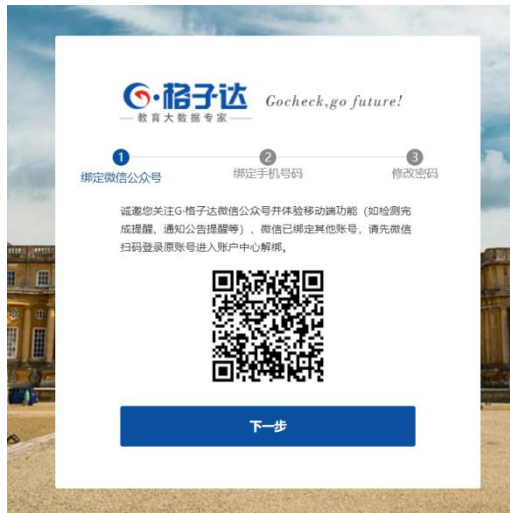
第二步：初次登陆关注微信公众号 (关注可直接微信登录且接收系统内提示消息)