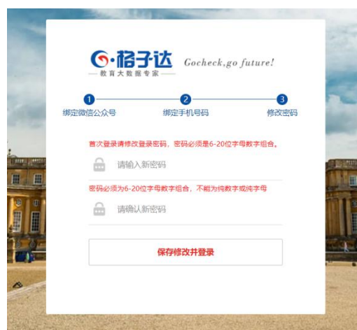
第三步：初次登陆修改密码